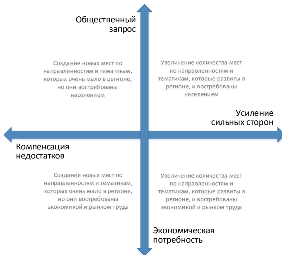
Рис. 2. Шкалы выбора тематики и тактики создания новых мест дополнительного образования