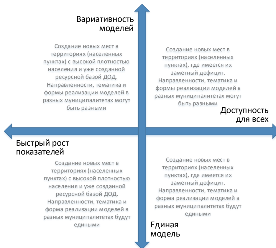
Рис. 4. Шкалы выбора модели создания новых мест с учетом актуальной управленческой политики