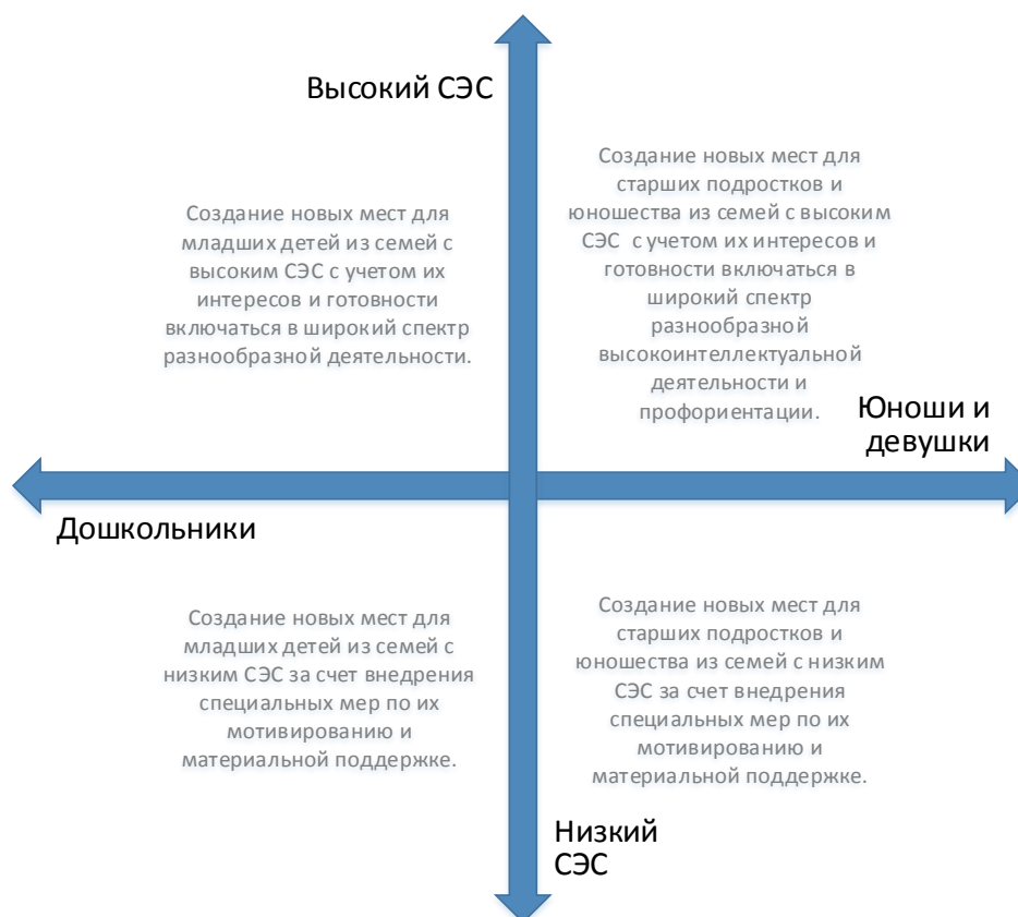
Рис. 5. Шкалы выбора модели создания новых мест по программам технической направленности с учетом особенностей контингента обучающихся

Вовлечение в программы детей из семей с низким образовательным и культурным уровнем потребует осуществления определенных PR-шагов, поиска мотиваторов для данных детей, в том числе материальных.