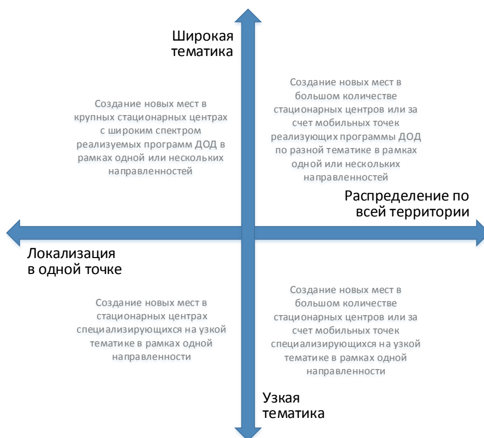
Рис. 3. Шкалы выбора масштаба и формы реализации новых мест по программам ДОД

При невыполнении хотя бы одного из них возникает необходимость пространственного распределения реализуемой модели через мобильные или сетевые решения.