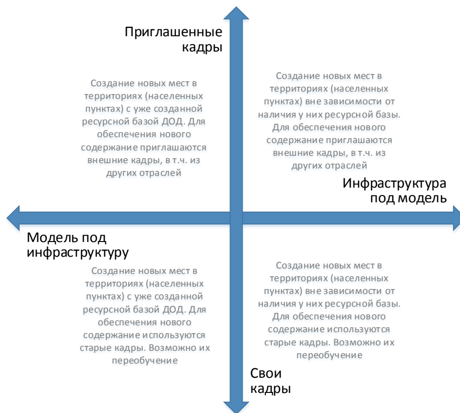
Рис. 6. Шкалы выбора модели инфраструктурного и кадрового обеспечения для типовой модели создания новых мест дополнительного образования

Следует отметить, что механизмы инфраструктурного и кадрового обеспечения не существуют в полярных вариантах. Решения даже в рамках реализации одной модели будут различны. Анализ перечисленных выше характеристик позволяет сделать эти точечные решения более точными и эффективными.