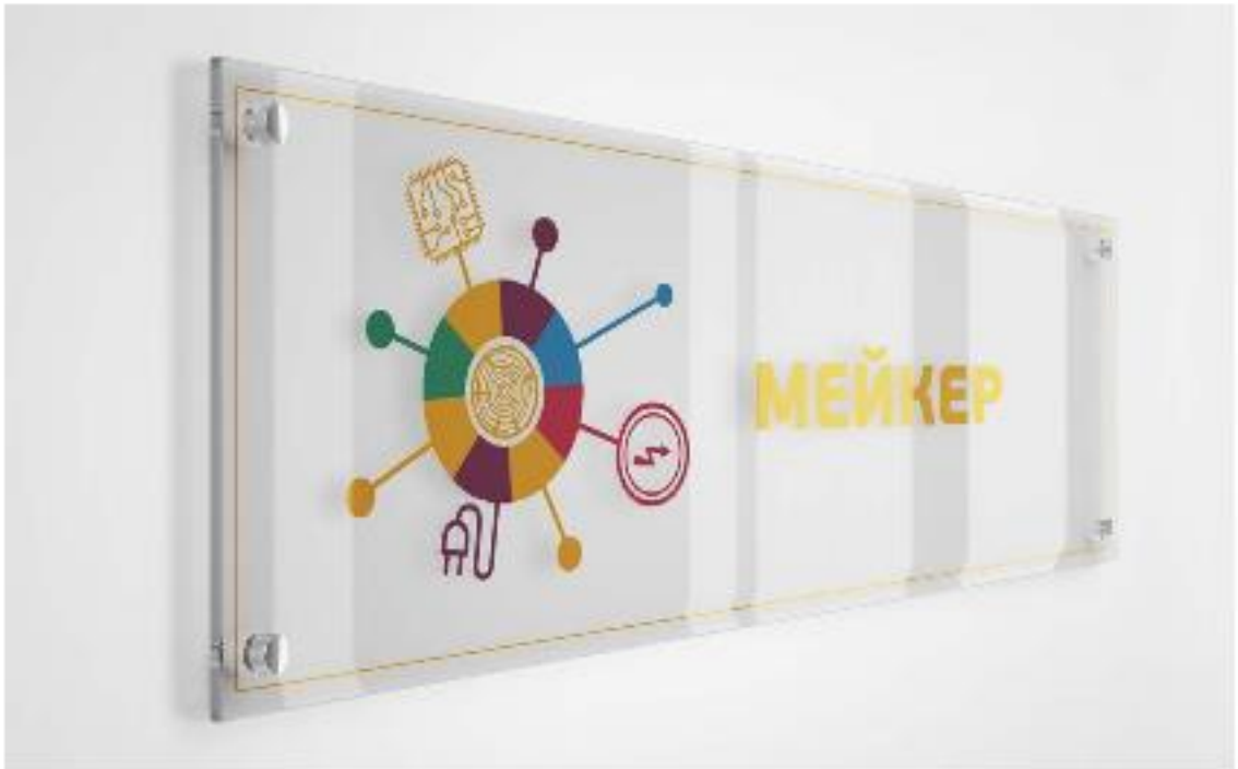
Примеры зонирования и визуализации современных пространств